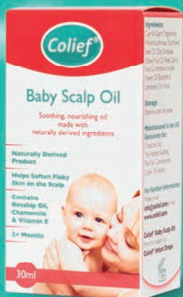
Detský olej na pokožku hlavy