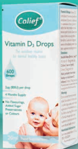
Vitamín D3 kvapky