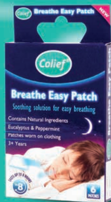
Náplast pre ľahšie dýchanie